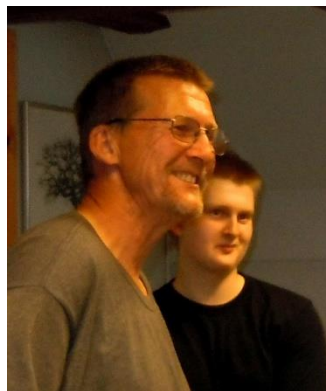
Bannow og Bannow