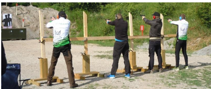
1. skydning - klarstilling og skydestilling