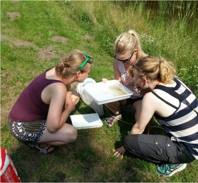
Biologer i arbejde

Som mange har oplevet, kvækker frøerne i søen lystigt i maj og juni. Der er to ganske tydelige og væsensforskellige kvæk. Så da biologerne meldte tilbage, at vi havde både den grønne frø og dens fætter latterfrøen, var vi ikke overraskede. At latterfrøen skulle være her, er lidt af en sensation, så hjemmesidens kontroludvalg har ikke godkendt observationen. Først til foråret, når vi kan fange én, vil vi være sikre på, om det er latterfrøen eller måske den grønne frø, som har lært at kvække, som sin fætter. Desuden blev der fundet springfrø og skrubbudser ved søen. I mosehullet findes en salamander, som ikke er særligt udbredt.