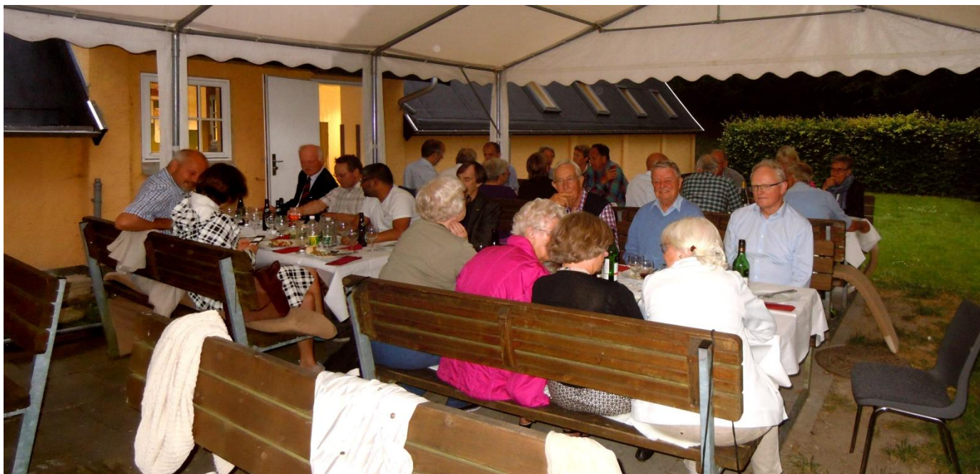
Middag i teltet