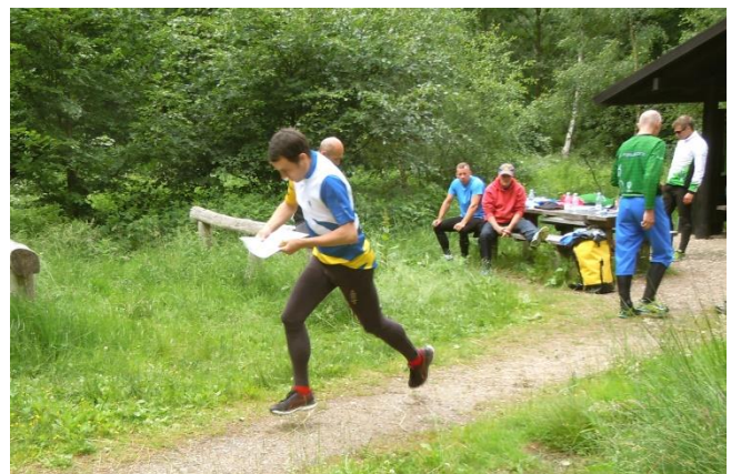
O-løb i Store Dyrehave - instruktion og start