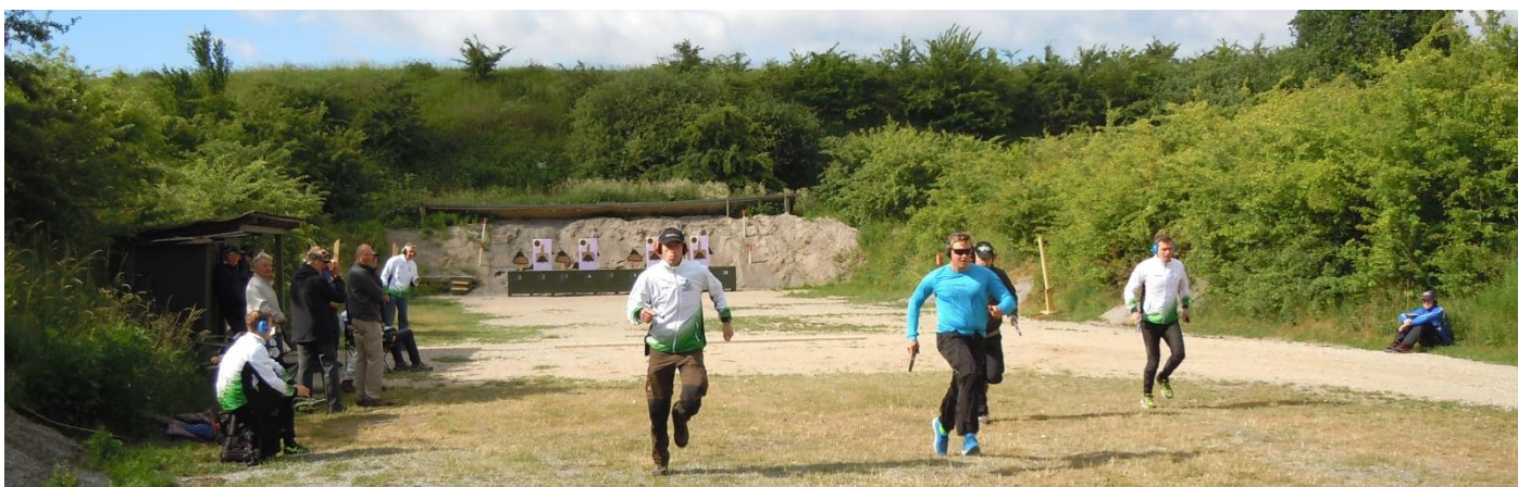
2. skydning - fremløb (først tilbage / så frem / så skyde - alt sammen på kort tid)

Efter skydning drog feltsporterne afsted mod en for deltagerne ukendt destination, da de næste discipliner forudsætter manglende lokalkendskab.