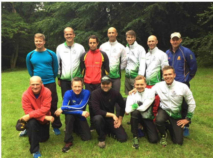
Feltsporterne samlet efter velafsluttet konkurrence