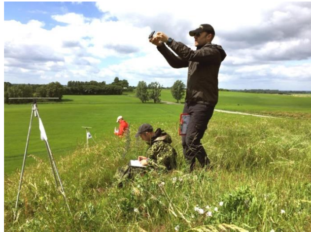
Kortlæsning - både Forsvarsmakten og AS Feltspport orienterer sig i dansk terræn

afstandsbedømmelse og kortlæsning nødvendige militære færdigheder. Præcis skydning med direkte skydende våben forudsætter, at afstanden til målet er kendt, ligesom præcise koordinater på målet er afgørende for effektiv anvendelse af mortérer og artilleri.